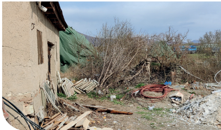
Nog veel werk te verzetten, durf te dromen!

Maar dan valt in februari 2022 Rusland Oekraïne binnen. De kerkenraad besluit om alle reserves (financieel, gebouwen, voedsel) klaar te maken voor de vluchtelingen die zeker zullen komen. Maandenlang staan vrijwilligers van de gemeente aan de grens te koken, gezinnen mee naar huis