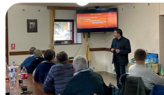
Bijbelstudie en lezing

Eenzijds kent de kerk veel uitdagingen, aan de andere kant mogen we ook weten dat het niet onze kerk is maar Gods kerk. Als ouderlingen moeten we vertrouwen op Gods Geest en alles doen met geloof en liefde voor de kerk, en daarbij de resultaten van God verwachten (1Kor 3:6).