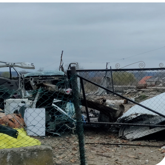
Armoede is zichtbaar