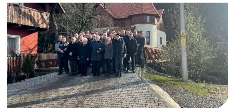
35 ouderlingen bij elkaar