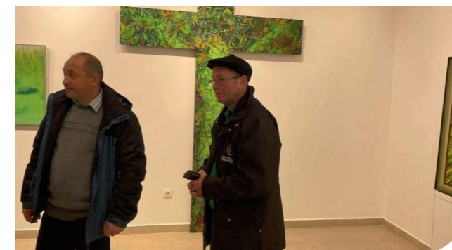
bezoek tentoonstelling Kuti Dénes

Fundament heeft met een financiële bijdrage de conferentie mede mogelijk gemaakt.