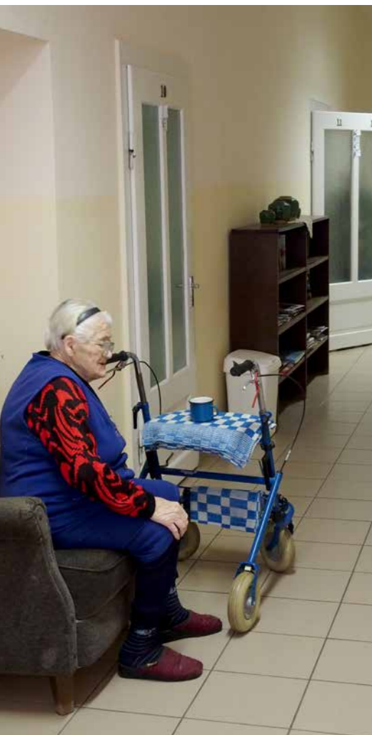
Een bewoner in de gang van het tehuis