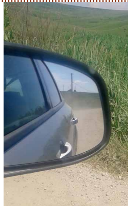
Veel kilometers met de auto

Het adres is: Rietvelddreef 44, 2992 HJ Barendrecht E-mailadres: secretarisfundament@outlook.com