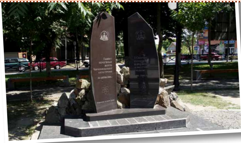
Het Tsjernobylmonument in Beregszász

producten uit de tuin bij het huis. Medicijnen worden centraal ingekocht. Dit is een aanzienlijke kostenpost. Ze zijn duur en worden steeds duurder.