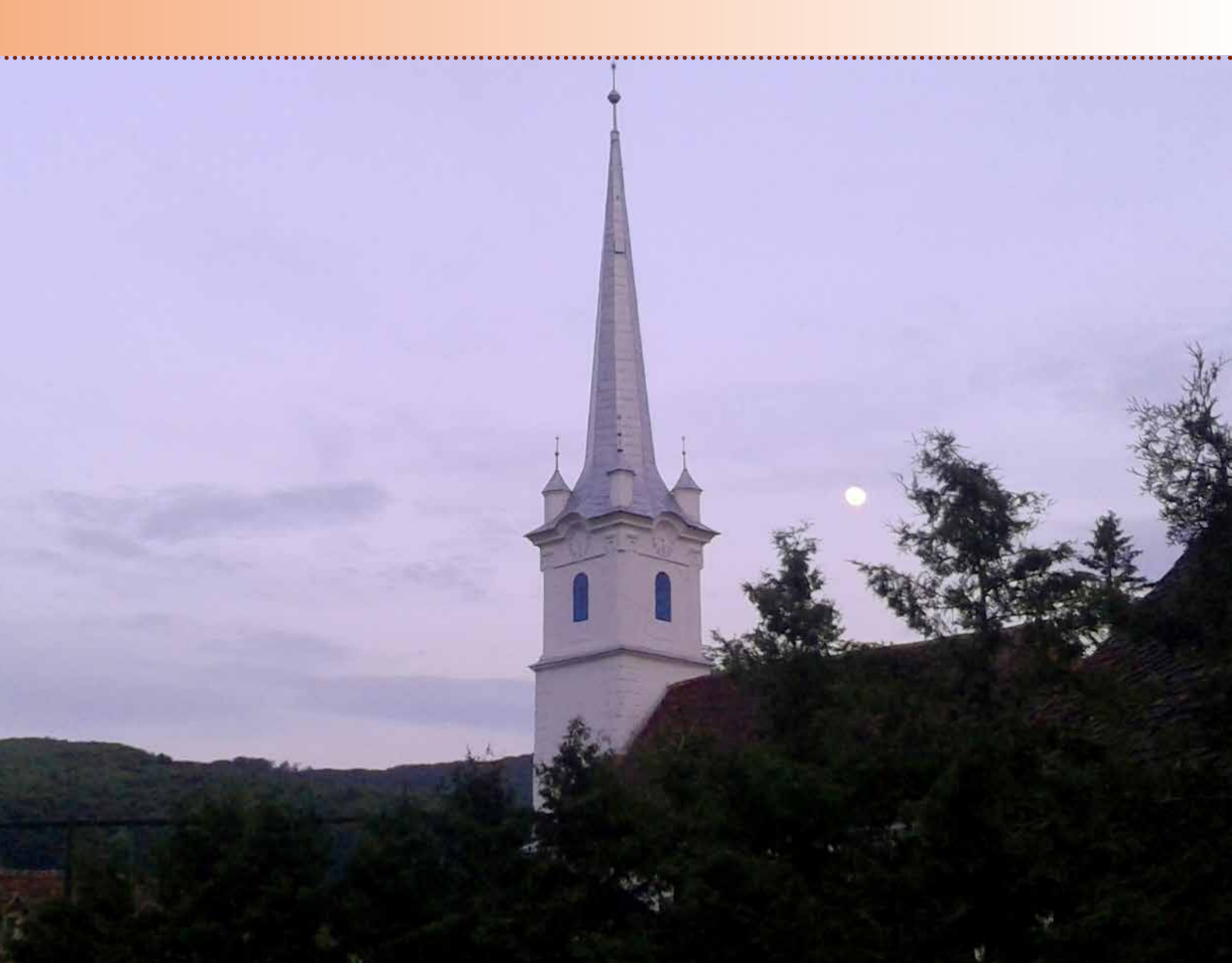
Hongaars gereformeerde kerk in Geses

De kerkdienst die we meemaken in Gáláteni heeft een bijzonder tintje: twee jongeren worden onderzocht op hun kennis van de Bijbel omdat ze zich