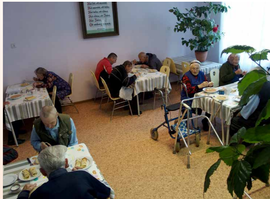
gezamenlijke maaltijd in de eetzaal