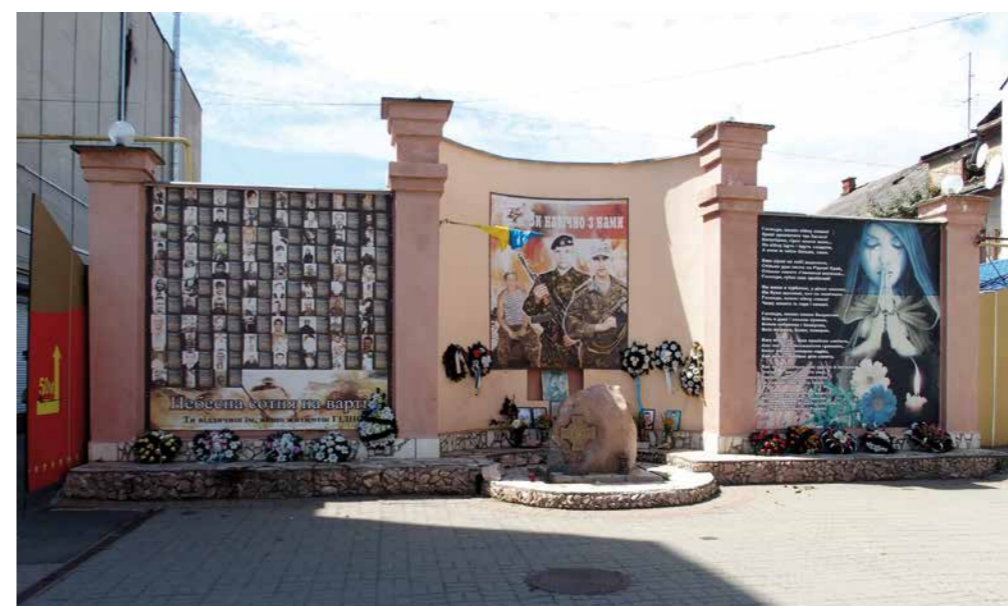
Beregszász, monument gesneuvelden

De nutskosten zijn hoog. Al vroeg in het seizoen moet de verwarming aan. Dat vraagt brandhout en aardgas. Drie »