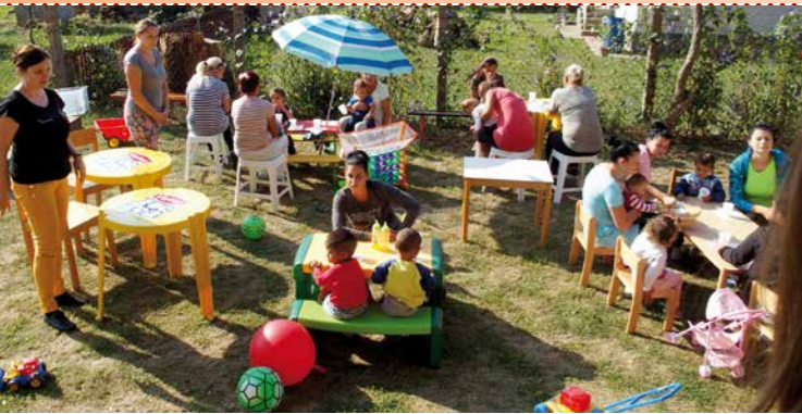
kinderwerk in Vilmány