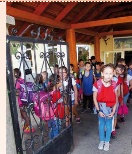
wachten op de bus

God daardoor toekomst zal scheppen. Onze school accepteert kinderen uit de Roma-bevolking, maar ook niet-Roma kinderen. Er zijn kinderen uit een gemiddeld gezin, armen, wezen, kinderen die leven met handicaps, er zijn kinderen met leer- en gedragsproblemen. We willen hen niet alleen maar “voor het leven” opvoeden, God heeft ons nog een veel grotere taak gegeven, dat we hen voor het eeuwige leven opvoeden en zo begeleiden.