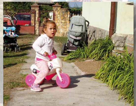
kinderwerk in Vilmány