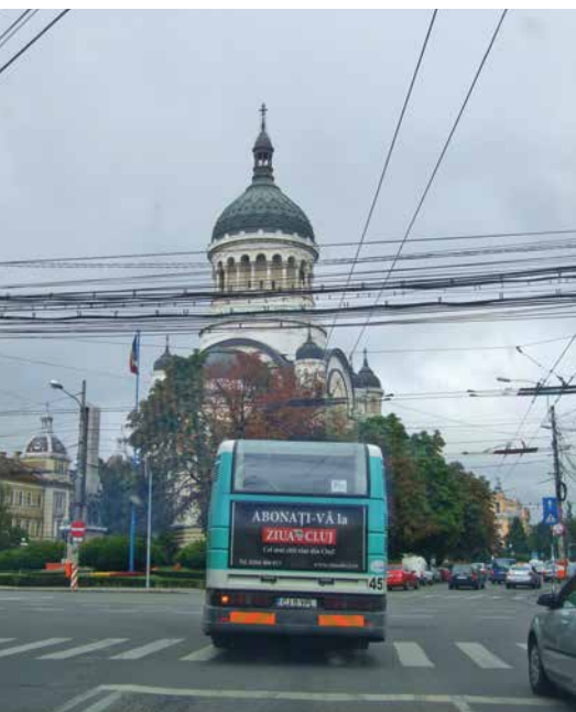
Theologisch Instituut Cluj