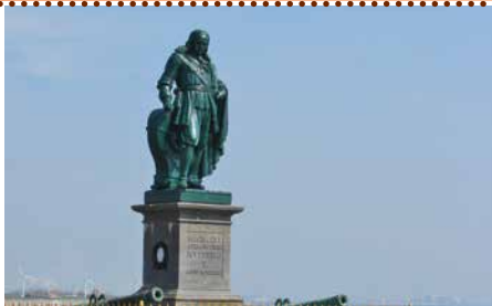
De Ruyter in Vlissingen