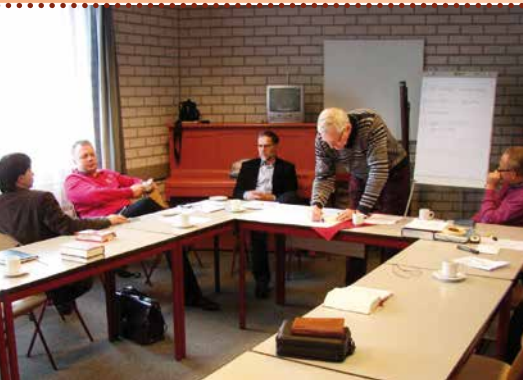
werk binnen Fundament

er veel. Er kwam meer vrijheid in Oost Europa. Het werd gemakkelijker om een netwerk van theologische contacten te onderhouden. Voorbereidingsreizen werden gemaakt om conferenties goed te laten verlopen. Conferenties bleven belangrijk om predikanten en ouderlingen te ondersteunen.