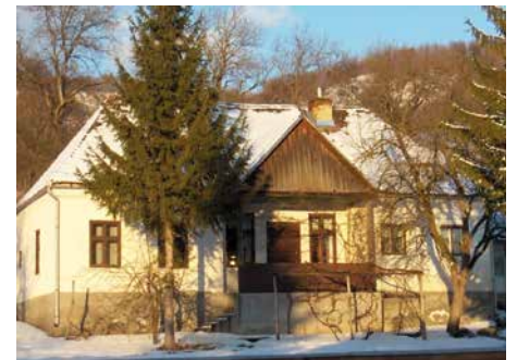
150 jaar oude pastorie