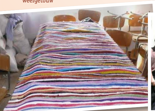
tapijt voor gemeentegebouw