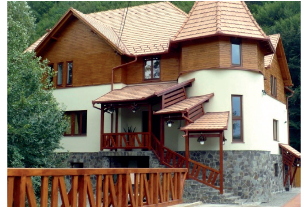
Parajd, Gereformeerde Centrum Urbán Andor

Sessie 3: Church leadership in practice In twee groepen werd dit weer bespro-