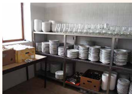
Keuken in ontwikkeling

Een oud gebouw is gerenoveerd; nieuw dak en nieuwe vloer. Later volgt een toiletgroep, verwarming, nieuwe kozijnen, betere verlichting, inrichting van een multifunctionele ruimte. Maar eerst is de keuken nodig en vervolgens de toiletgroep. Met die keuken komt de mogelijkheid voor grootschaliger voedselhelp en ontmoeting met mensen in een afgeschermd, verwarmde ruimte. De kerk in Vaida heeft er onvoldoende middelen voor. Fundament geeft hier hulp. De plannen krijgen steeds meer vorm.